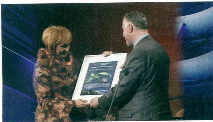
Televizija Vaš kanal spremlja projekt Rastoče knjige že 15 let, vse od njenega začetka, in je edini medijski prejemnik Zlatega lista Rastoče knjige.